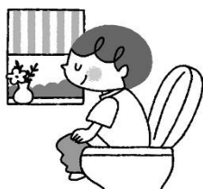
毎朝きもちよく排便する