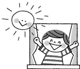
早起きして朝日をあびる