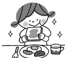
朝食をたべてエネルギー補充