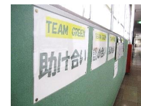
みんなを迎える準備を進めています。