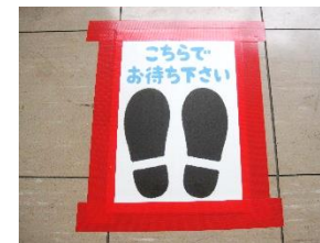
<感染予防> 流しの密を避ける対策